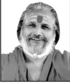
:: પ્રવક્તાશ્રી ::