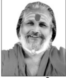
:: પ્રવક્તાશ્રી ::