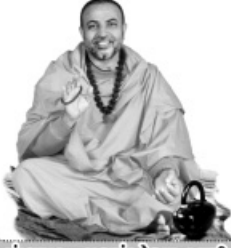
સંસ્થાપક : મહામંડલેશ્વર સ્વામી