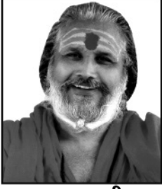
:: પ્રવક્તાશ્રી ::