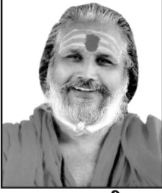
:: પ્રવક્તાશ્રી ::