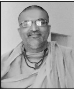
:: પ્રવક્તાશ્રી ::